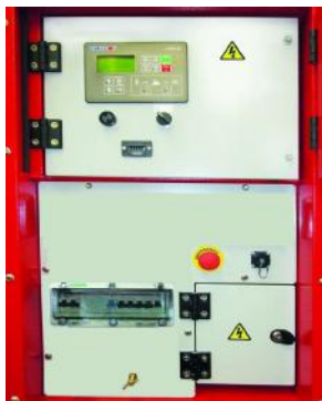
PANEL DE SALIDA ACP

Bornero para conexión desde ACP al cuadro LTS.